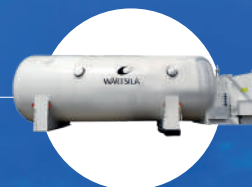
1 X SERBATOIO LNG TYPE C TANK WARTSILA 150 m 3