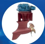
2 X PROPULSORI AZIMUTALI 360° KONGSBERG AZIPULL 100 CP L 2700 kW