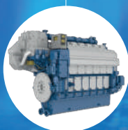
3 X DUAL-FUEL (DIESEL + LNG) 6L34DF WARTSILA 2850 kW e