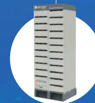
2 X BATTERIE AL LITIO AIR COOLED CORVUS ORCA MAX. 1000 VDC 1017 kWh