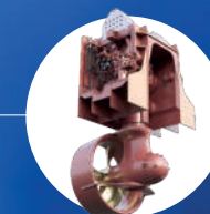
2 X PROPULSORI RETRATTILI AZIMUTALI KONGSBERG TCNS 075 FP 850 kW